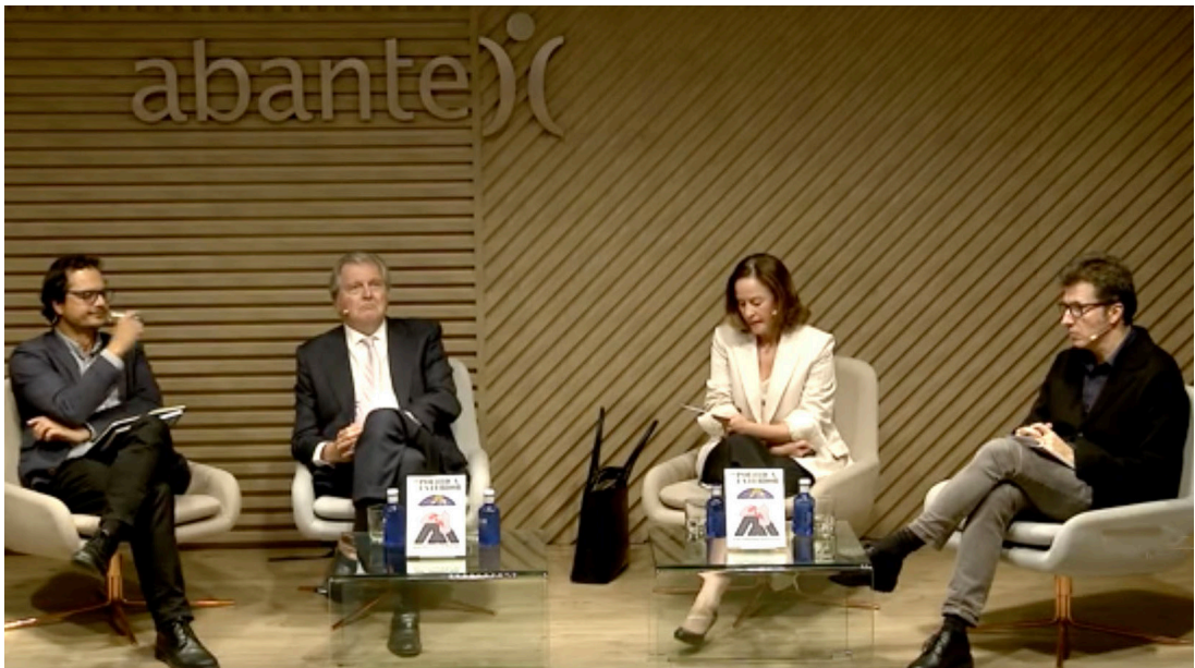
“Las reformas de Europa” (Abante, 10 de octubre de 2024)