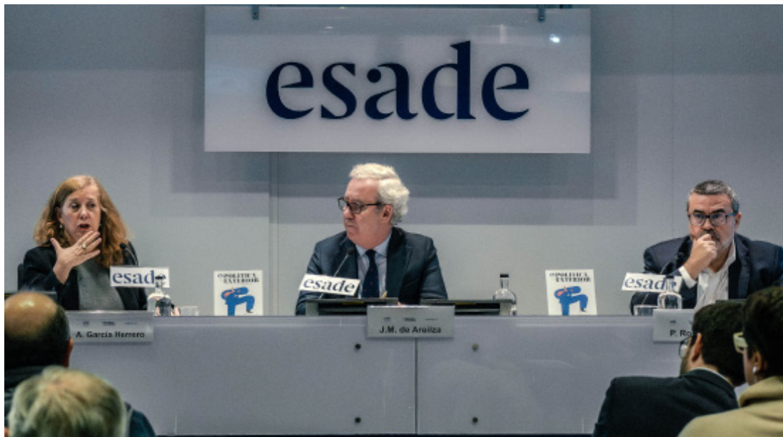
“La huella global de Trump” (Esade, 11 de diciembre de 2024)