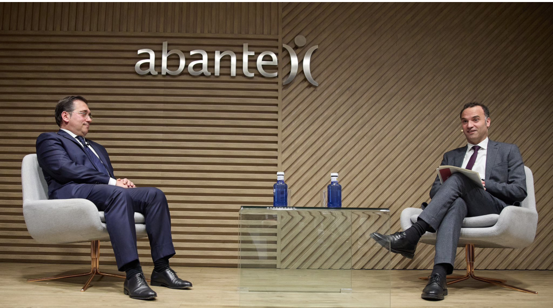
“El mundo que nos viene” (Abante, 29 de abril de 2024)