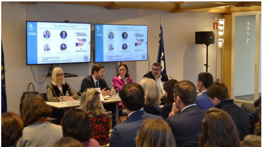
“De Ucrania a Gaza” (IE, 28 de febrero de 2024)