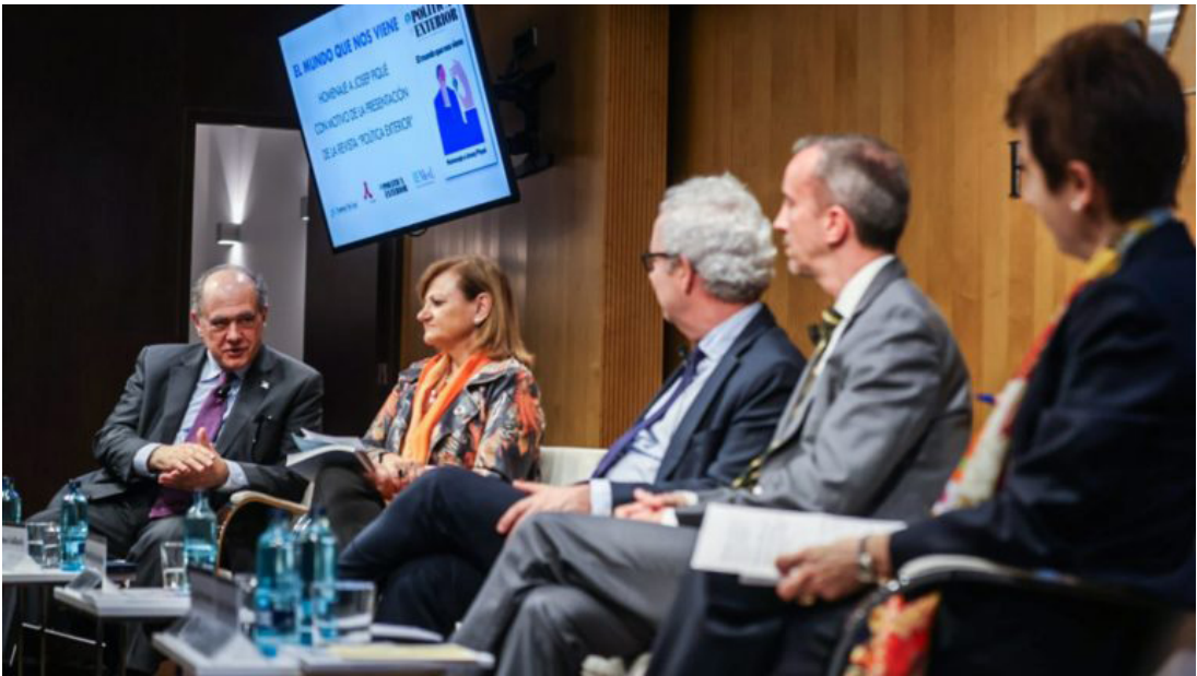
“El mundo que nos viene” (Palau Macaya, 18 de abril de 2024)